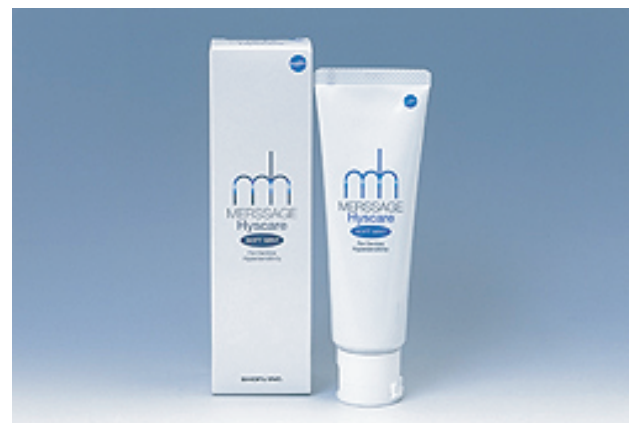
メルサージュヒスケア 950円